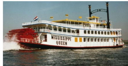
„Raddampfer Mississippi Queen“

Die „Ole Land 2“ (bis 100 Pers.), das „Elbtraumschiff Solar“ (bis 150 Pers.), das „Küstenmotorschiff Greundiek“ im Stader Hafen (bis 100 Pers.), der „Raddampfer Mississippi Queen“ (bis 400 Pers.), sowie das „Genießerschiff Schwingeflair“ (bis ca.60 Pers.) lassen für keine Feier Wünsche offen.