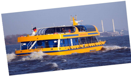
„Ole Land 2“

Ob eine Hochzeit, eine Familienfeier, eine Betriebs- oder Vereinsfeier, eine Tagung, ein Kongress, ein maritimes oder exklusives Event, mit unserem "Erlebnisservice" an Bord werden wir Sie und Ihre Gäste kulinarisch verwöhnen und somit Ihren „Traum zum Erlebnis machen“!